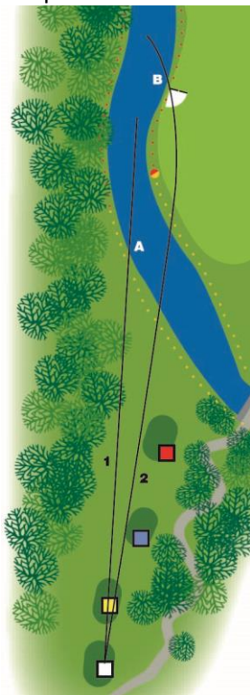
Depart du trou no. 9

Voici quelques exemples à Maison Blanche qui montrent vos options: